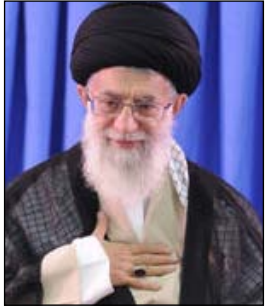
عزت امروز ملت ایران از نتایج عمل به قرآن است