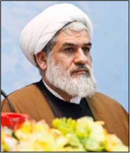
کمیسیون پژوهش و آموزش شورا