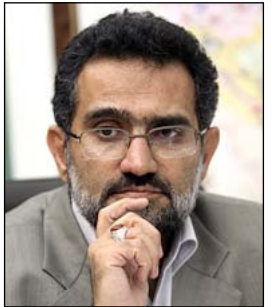
نمایشگاه قرآن فرهنگ بیداری